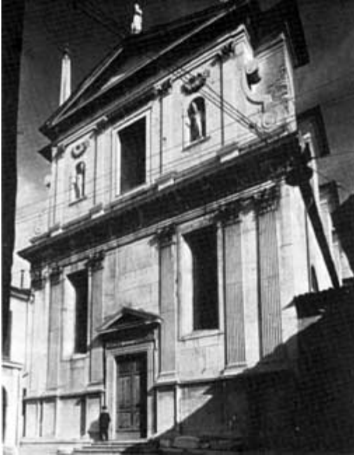
CHIESA DI S. GIULIA: FACCIATA