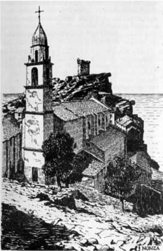
NONZA - SANTA GIULIA