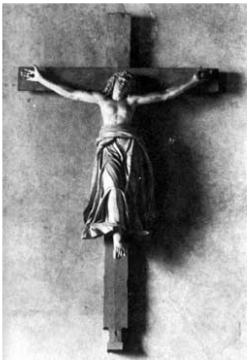
SANTA GIULIA CROCEFISSA Scuola dei Carra