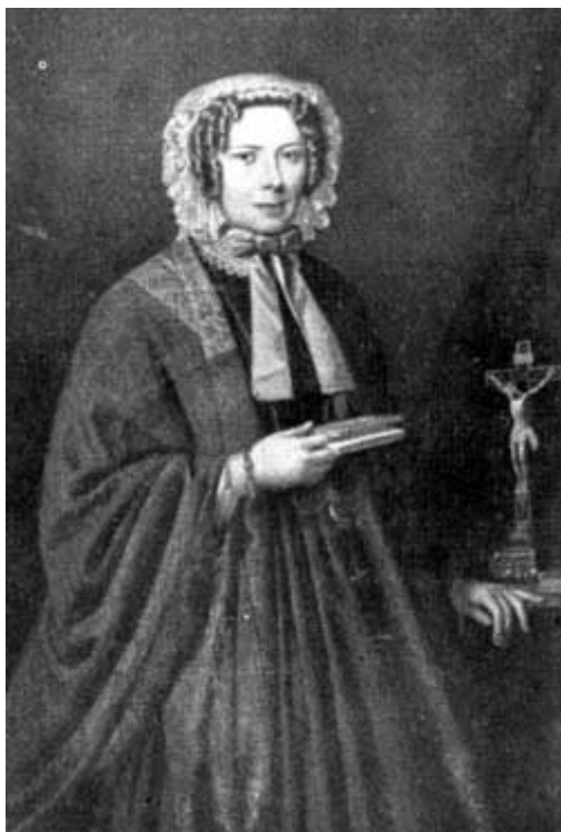
LA MARCHESA GIULIA DI BAROLO