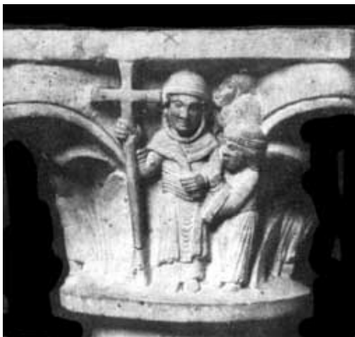
SANTA GIULIA TRA LE BADESSE E LE MONACHE (Capitello della cripta di S. Salvatore, Brescia)

Le più antiche raffigurazioni artistiche sono offerte in un capitello di scuola antelamica del sec. XII in cui la santa è raffigurata su due lati nel martirio e assieme alla Badessa e alle suore del monastero bresciano. I capitelli che adornano la cripta del monastero sono oggi nel Museo Cristiano. Allo stesso periodo (sec. XII-XIII) viene fatto risalire un affresco ritrovato nel 1958 sull'esterno della vicina chiesa di S. Salvatore.