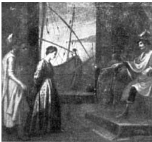
LA SANTA DAVANTI AL GIUDICE Quadro di G. B. Marcati - sec. XVI.