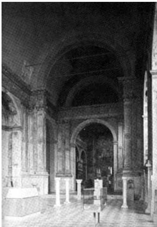
INTERNO DELLA CHIESA DI S. GIULIA A BRESCIA