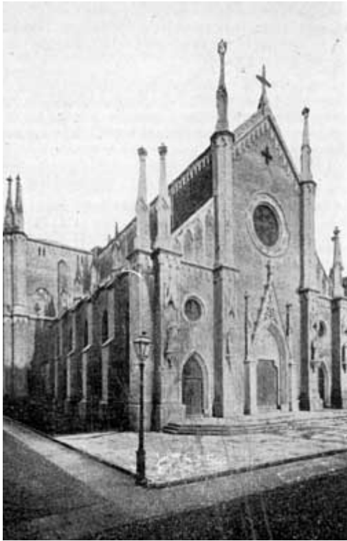
FACCIATA DELLA CHIESA PARROCCHIALE DI S. GIULIA