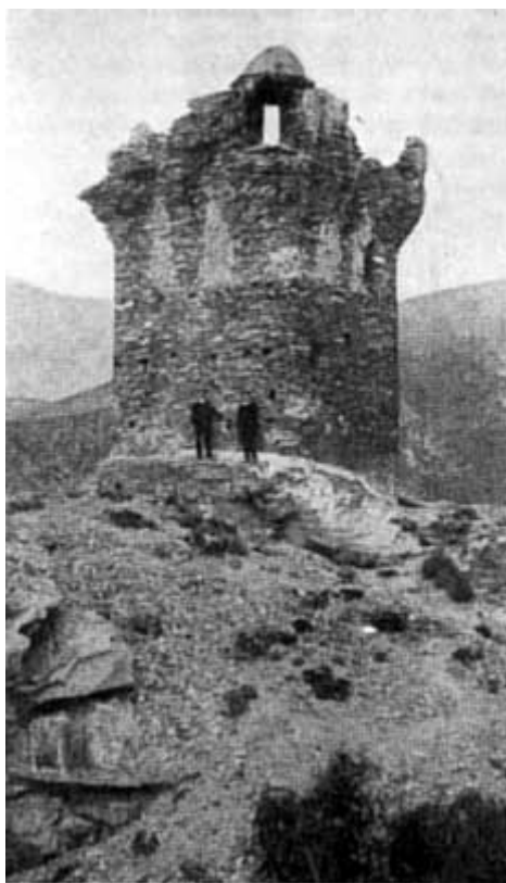
NONZA. LA STORICA TORRE