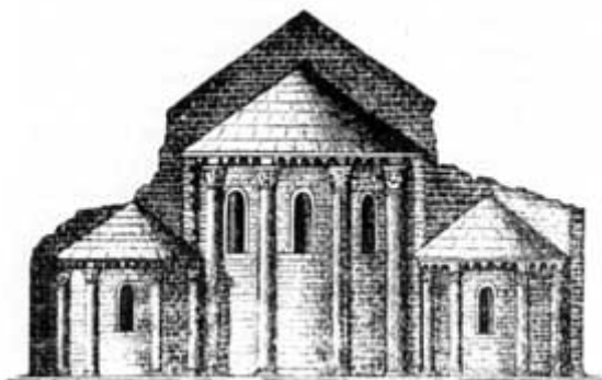
ABSIDE DI SANTA GIULIA DI BONATE