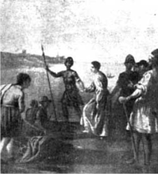
ARRESTO DELLA SANTA Quadro di G. B. Marcati - sec. XVI