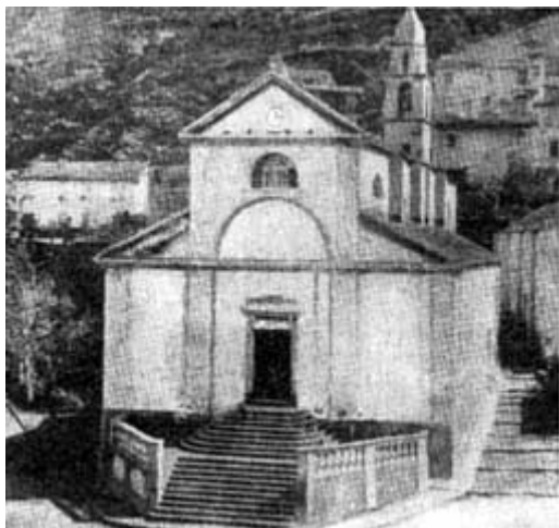
NONZA - SANTA GIULIA

Il Gianola annota che nel coro esiste un grande quadro che la rappresenta crocifissa. Lo stesso soggetto viene ripetuto in un damasco rosso molto antico che viene portato in processione il 22 maggio. La processione istituita nel 1927 dallo zelante e attivo don Morazzini-Pietri con scadenza triennale richiama grandissima folla da tutto Capo Corso, da Bastia e da tutta l'isola, mentre il paese innalza un magnifico arco di trionfo. Ogni famiglia accende ceri dinnanzi alla statua della santa o al reliquiario in bronzo dorato contenente un pezzo del cranio e due vertebre 9 .