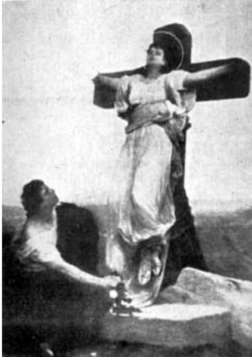
DOPO LA CROCFISSIONE, EUSEBIO DESTATOSI DAL LETARGO DEPONE FIORI AI PIEDI DELLA CROCE DELLA SUA DILETTA E SANTA SCHIAVA