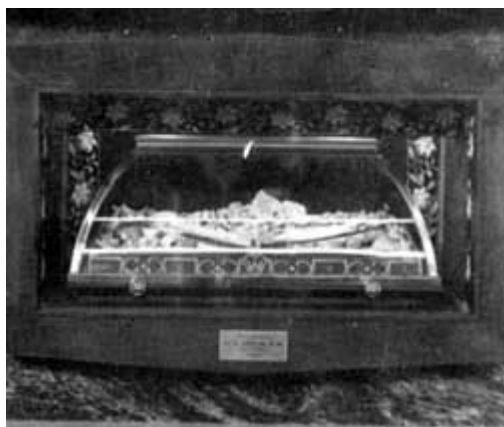
L'URNA DI SANTA GIULIA (Nel sarcofago dell'altare maggiore della chiesa del Villaggio Prealpino - Brescia)