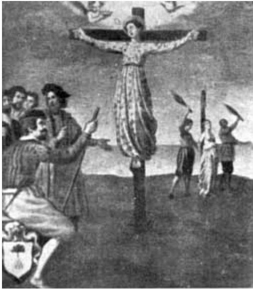
FUSTIGAZIONE E CROCISSIONE DELLA SANTA (Quadro di G. B. Marcati - sec. XVI)

Fattala slegare, tentò con nuove minacce e promesse di farla abiurare dalla fede cristiana, ma si trovò di fronte ad una resistenza sempre più invincibile. Quasi non avesse sofferto alcun tormento Giulia esclamò: