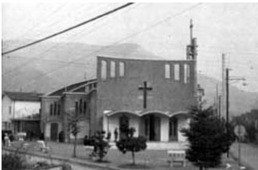
CHIESA DI S. GIULIA VILLAGGIO PREALPINO - BRESCIA

Infatti erano appena entrate le prime famiglie che c'erano già il prete e la chiesa, sia pure provvisoria.