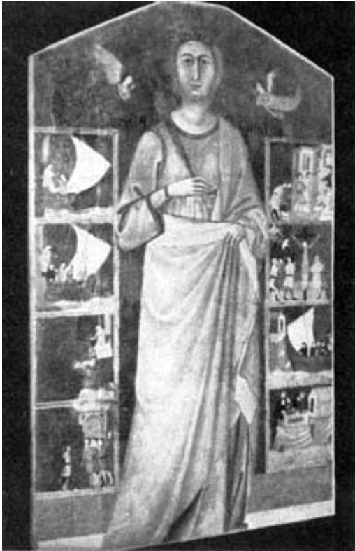
PREGEVOLE QUADRO DI SANTA GIULIA (Scuola giottesca)