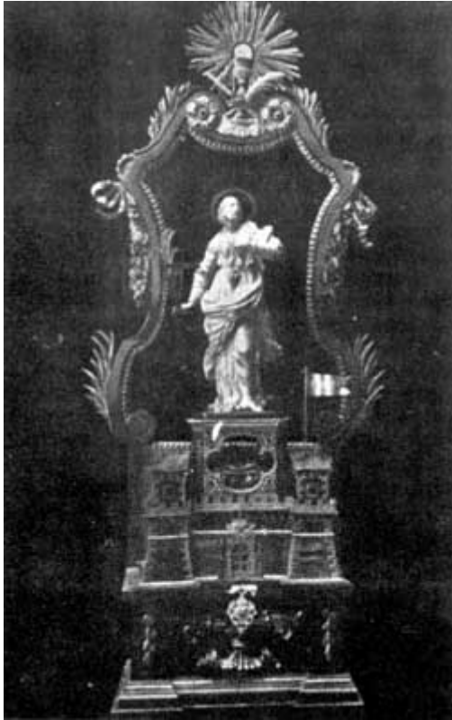
RELIQUIARIO IN ARGENTO CONTENENTE RELIQUIE DELLA PATRONA S. GIULIA