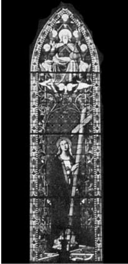
VETRATA DELLA CHIESA DI SANTA GIULIA IN TORINO